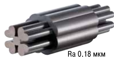
Ra 0,18 мкм

ЭКСПОРТ В ДЕСЯТКИ СТРАН, ВКЛЮЧАЯ ЯПОНИЮ, США И ЗАПАДНУЮ ЕВРОПУ