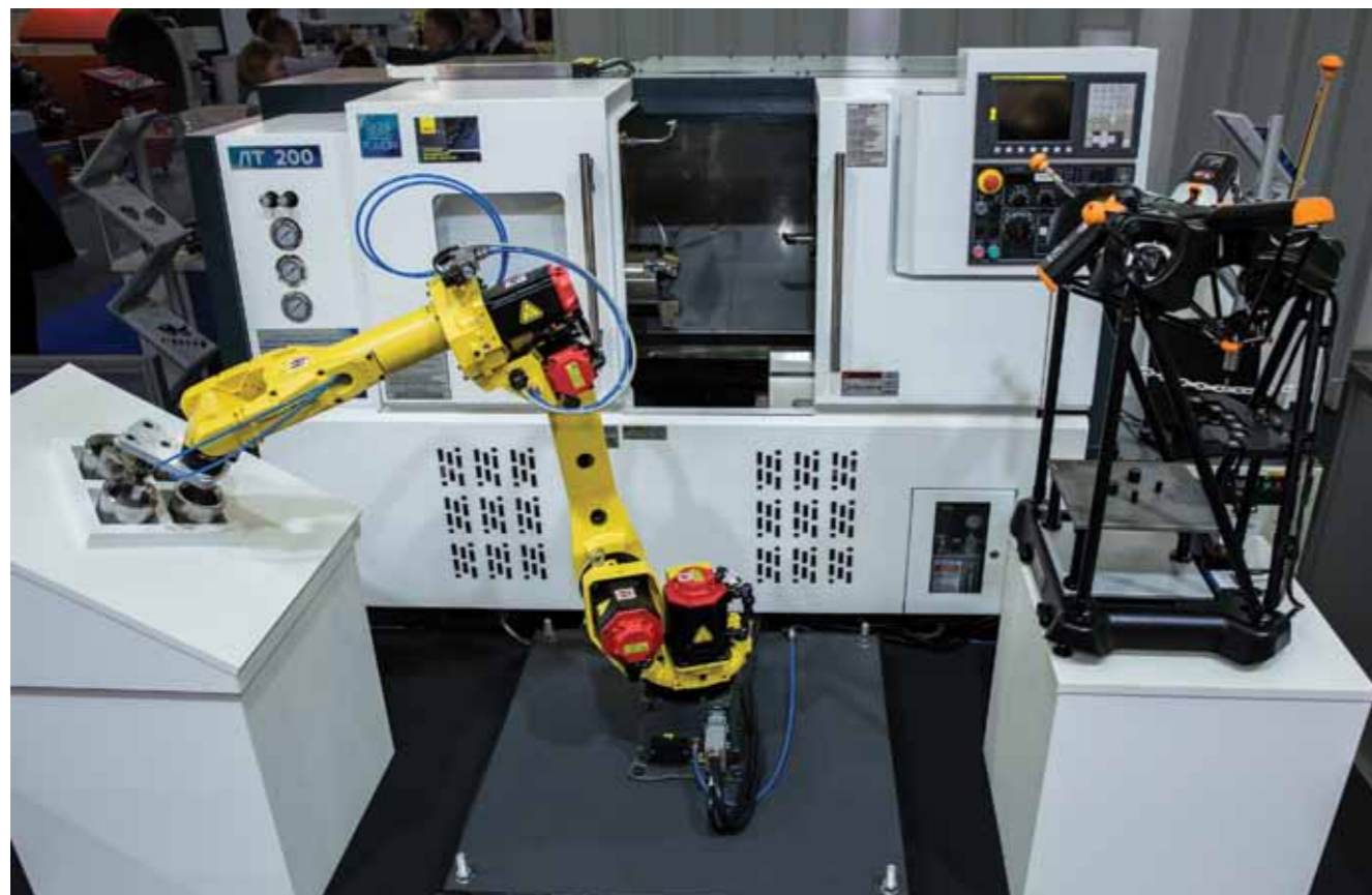
03 / 2021 • Издательство: «ИТО» • ito@ito-news.ru

В 2013 году подписаны соглашения с компаниями индийской группы ACE Micromatic о сборке станков в России. С тех пор ведется последовательная работа по постепенной локализации производства.