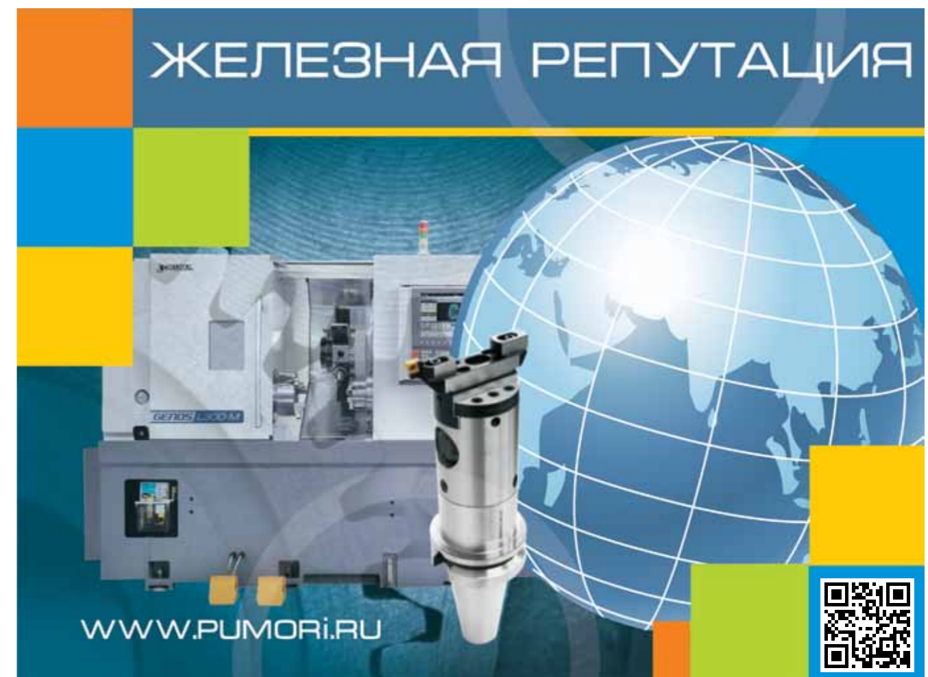
03 / 2021 • Комплект: ИТО • www.ito-news.ru