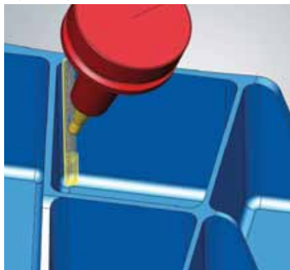
Новая функция обеспечивает эффективную 3D и 5-осевую обработку остаточного материала в углах

hyperMILL® 2020.1 решает вопрос с требующей много времени обработкой остаточного материала: стратегия 3D и 5-осевой обработки остаточного материала в углах объединяет оптимизированные параллельные траектории движения инструмента и траектории движения инструмента уровня Z. Стратегия 5-осевой обработки остаточного материала в углах позволяет выполнять индексированную обработку труднодоступных углов.