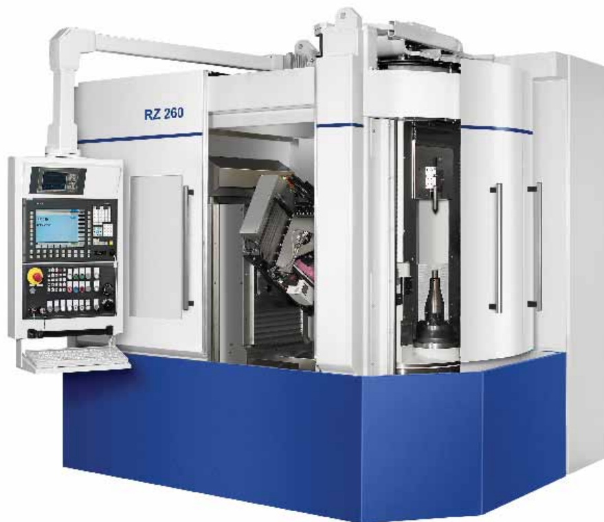
Станок RZ 260 – основа нового модельного ряда с модульным принципом конструкции, позволяющий гарантировать каждому Заказчику индивидуальное решение в зависимости от поставленных задач

Werkstatt + Betrieb • МЕТАЛЛООБРАБОТКА • 2014