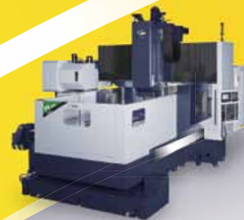
PV-2216 / 3216 / 3221 / 3226 / 4216 / 4221 / 4226 / 5221 / 5226 / 5231 портальные обрабатывающие центры