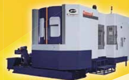
Campro 6 Горизонтальный обрабатывающий центр