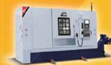
CPL-10MC / 20 MC / 30MC / 3512MC / 3518 MC / 3010SY Токарно-фрезерный центр с ЧПУ