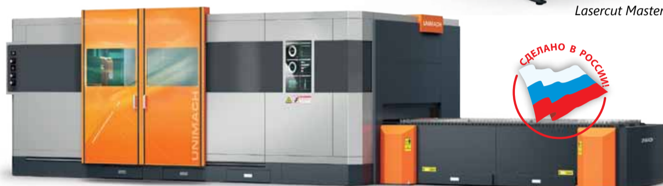
Lasercut Professional M2

Мы разрабатываем и создаем оборудование с учетом производственных реалий, не адаптируя ограниченные и стандартизированные решения, а внося действительную новизну и удобство в процесс раскроя металла. Такой подход предоставляет возможность полноценной интеграции раскройных комплексов Юнимаш® в вашу существующую систему управления производственными процессами.