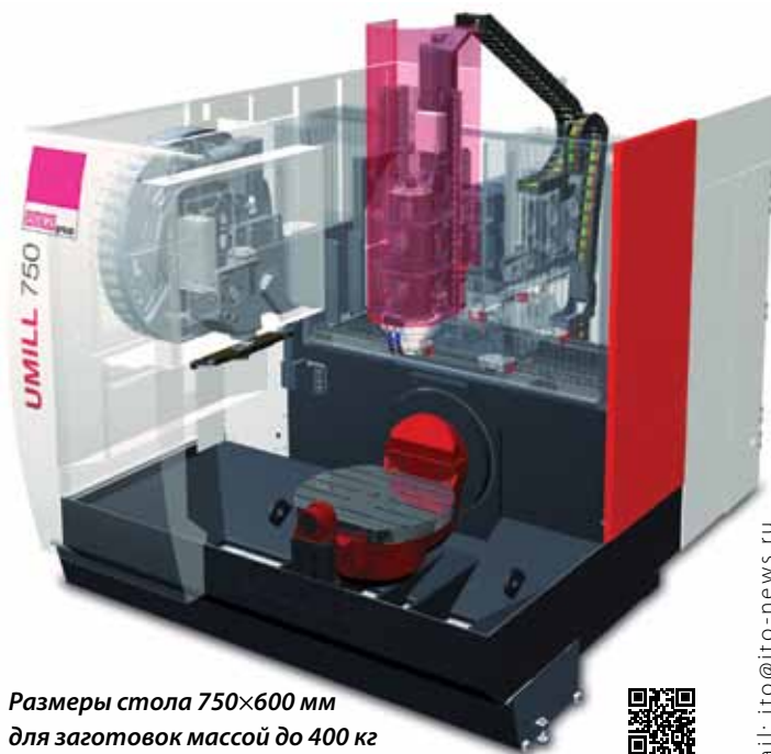
Размеры стола 750×600 мм для заготовок массой до 400 кг