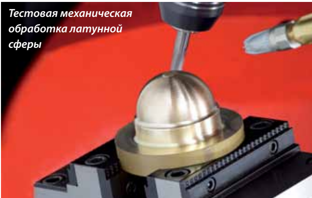
Тестовая механическая обработка латунной сферы