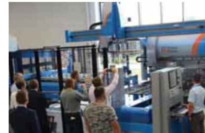
Демонстрируется процесс производства офисной мебели

монстрационным залом для покупателей со всех уголков мира, в котором установлены 11 станков собственного производства и полная производственная линия по выпуску электрошкафов, офисной мебели. Новый центральный офис и центр передовых технологий выполнены с применением новейших энергоэффективных технологий: от теплоизоляционных материалов до производства энергии с применением фотоэлектрических, солнечных панелей и геотермальной электростанции. Даже система освещения в центре работает в полностью автоматическом, бытовом режиме, эффективно снижая затраты