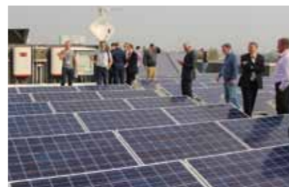
Здание центра использует солнечную энергию

Центр передовых технологий построен в Италии, где находится 4 завода холдинга. Пьемонт тоже выбран не случайно – это регион высококвалифицированных специалистов. Здесь же компания осуществляет некоторые свои проекты: ведущее предприятие по производству