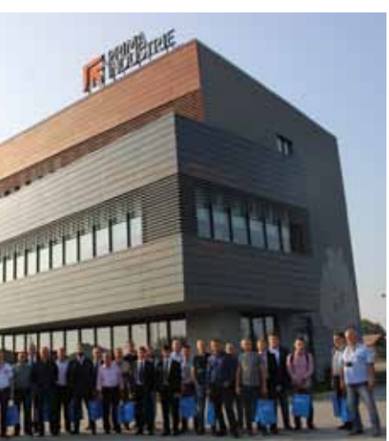
В конце сентября текущего года делегация российских клиентов посетила центр Прима Пауэр (Prima Power)

08 / 2016 • Издательство: «ИТО» • e-mail: ito@ito-news.ru