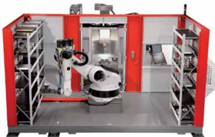
Рис. 6. Роботизированная система с двумя магазинами паллет при загрузке в 5-осевой высокопроизводительный обрабатывающий центр (передняя стенка защитного кожуха для наглядности снята).

Роботизированные системы повышенной грузоподъемности RS3 и RS4 используются в качестве манипуляторов для паллет различных размеров ( RS3 – 630х630х400 мм и RS4 – 1000х800х800 мм) с транспортной массой, соответственно, до 500 и 1000 кг. Используемые для них магазины могут иметь индивидуальную конфигурацию с возможностью интеграции двух обрабатывающих центров. В целом роботизированные системы RS2 , RS3 и RS4 разработаны в качестве «платформ», на базе которых возможна реализация индивидуальных технических решений в соответствии с требованиями заказчика. Дополнительным вариантом является роботизированная система RS 2L , которая представляет собой роботизированную ячейку с роботом, перемещающимся линейно по 7-й оси, причем из расположенного в линию магазина осуществляется снабжение нескольких установленных в ряд обрабатывающих центров. Роботизированное оборудование позволяет реализовать высокоэффективное производство деталей в течение семи дней, что наглядно доказали и продолжают доказывать уже смонтированные у заказчиков 120 роботизированных производственных систем Hermle. На сегодняшний день работают более 200 комплексных производственных систем с различной степенью автоматизации, причем именно с такой, какая подходит для заказчика.