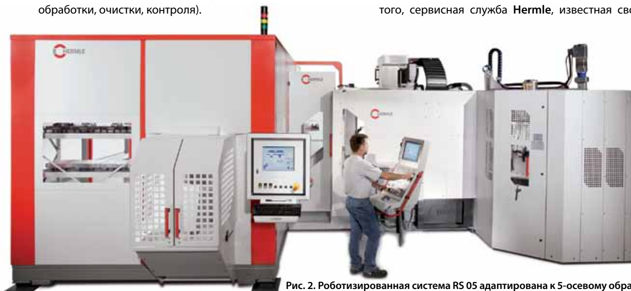
Рис. 2. Роботизированная система RS 05 адаптирована к 5-осевому обрабатывающему центру C 40 U dupaPic. Роботизированная система имеет модульную конструкцию в качестве манипулятора для обрабатываемых деталей и/или паллет.

Так как технологические процессы на предприятии специального машиностроения отличаются от предприятия, выпускающего серийную продукцию, фирма HLS ведет свою деятельность как самостоятельная фирма, пользуясь при этом всеми необходимыми ресурсами основной фирмы. Важнейшее преимущество для заказчиков и пользователей заключается в том, что они получают готовые комплексные решения от одного ответственного исполнителя, причем все места стыковки конструкции, систем управления и программного обеспечения оптимизированы изготовителем. Кроме того, сервисная служба Hermle , известная своим высоким