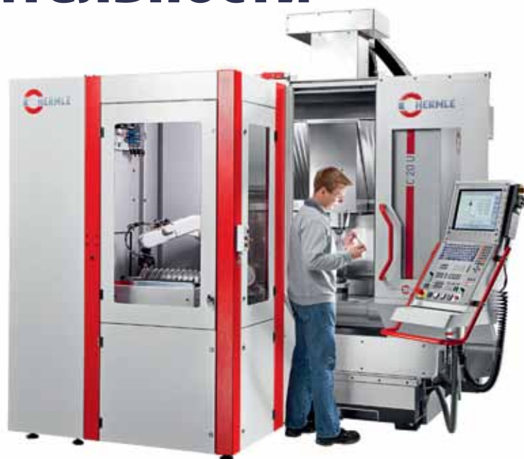
Рис. 1. Роботизированная система RS 05, адаптированная к 5-осевому обрабатывающему центру C 20 U. Автоматизированная установка площадью 2 м 2 прекрасно подходит для предприятий медицинской техники и точного приборостроения