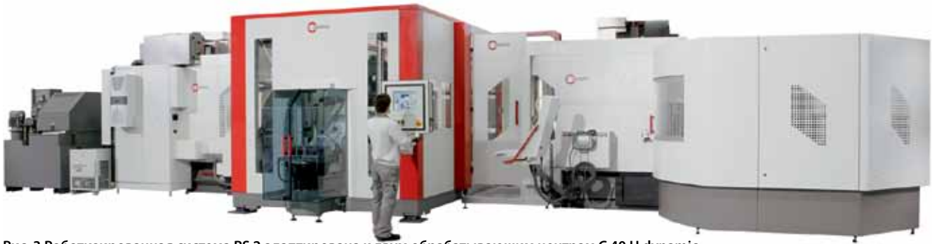
Рис. 3 Роботизированная система RS 2 адаптирована к двум обрабатывающим центрам С 40 U dynamic. Один робот обслуживает два станка. При этом возможна работа параллельно на обоих станках в ручном или автоматическом режиме.

качеством, выполняет все соответствующие работы по техническому обслуживанию, благодаря чему заказчик и в этой сфере имеет одного-единственного компетентного партнера. Для Герда Шорпа, директора-соучредителя фирмы HLS Hermle Leibinger Systemtechnik GmbH, очевидно, что по причине усложнившихся задач системной интеграции, профиль предъявляемых требований в значительной степени изменился, вследствие чего он рассматривает сферу деятельности фирмы HLS как в производстве специальных станков, так и в интеграции систем: «В зависимости от организационной структуры пользователя и применяемой технологии предпочтение отдается соответствующим образом согласованной автоматизации. У предприятия серийного производства требования иные в сравнении с штучным или мелкосерийным производством. Поэтому мы в тесном сотрудничестве с нашим головным предприятием и другими изготовителями предлагаем точно подобранные компоненты, которые затем проектируем, изготавливаем и монтируем у заказчика. При изготовлении деталей, узлов и подсистем мы используем мощности головного предприятия, с которым мы имеем общую цель относительно поставок и соблюдения сроков. Так как мы, в противоположность другим производителям специальных станков и системной интеграции, владеем специализированным «ноу-хау» в технологии обработки резанием, а также компетенцией в разработке технологических решений, заказчик, обращаясь к нам, получает в нашем лице надежного партнера».