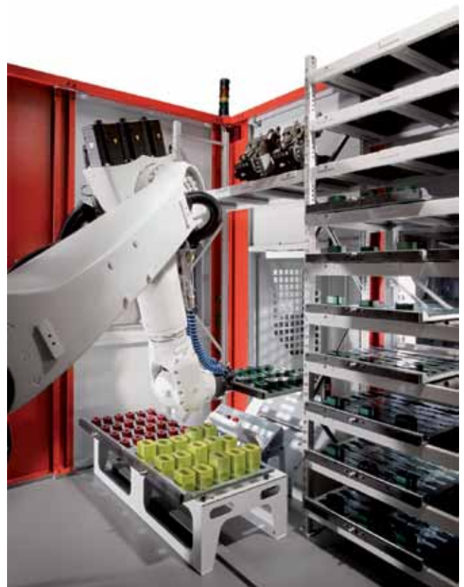
Рис. 4. Роботизированная система RS 2 адаптирована к двум обрабатывающим центрам С 40 U dynamic. Один робот обслуживает два станка. При этом возможна работа параллельно на обоих станках в ручном или автоматическом режиме.

Другим оборудованием, обеспечивающим автоматизированное производство деталей, являются системы IH типоразмеров IH 30, IH 60 и IH 100. Они представляют собой закрытые и адаптируемые к обрабатывающим центрам стандартизованные модули, включающие систему манипуляторов, в которые можно загружать, в зависимости от размера, до 90 паллет или обрабатываемых деталей. Они хранятся там, автоматически подаются телескопической рукой на обработку и после обработки возвращаются обратно в магазин. В зависимости от времени обработки деталей это обеспечивает автономный режим работы в одну или несколько смен. Системы IH в зависимости от типоразмера рассчитаны на транспортный вес до 30 кг (IH30), 60 кг (IH60) или 100 кг (IH100).