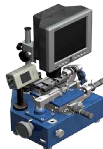
Прибор прецизионный мод. БВ-2021 для измерения диаметров малых отверстий (D 1÷4 мм)