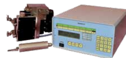
Прибор мод. БВ-4312 управляющий с настольной скобой и осевой ориентацией

НИИИзмерения берет на себя гарантийный ремонт и сервисное обслуживание всех выпускаемых средств контроля. Все приборы, поставляемые институтом, снабжаются Сертификатом о калибровке, на проведение которой имеется Аккредитация Госстандарта.