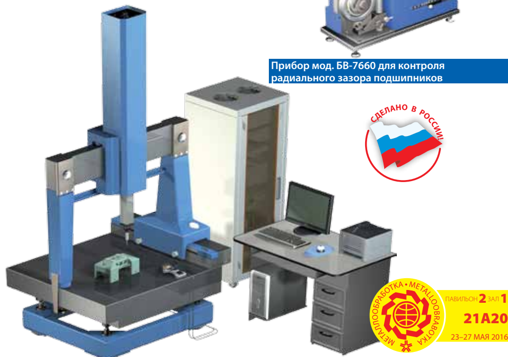
Координатно-измерительная машина БВ-2050 с пределами измерения 600×600×500 мм