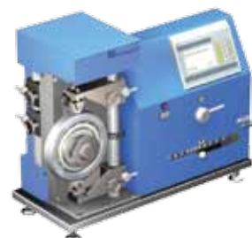
Прибор мод. БВ-7660 для контроля радиального зазора подшипников