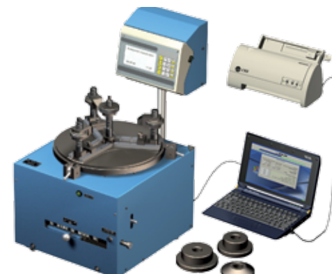
Прибор мод. БВ-7661 для контроля осевого зазора подшипников