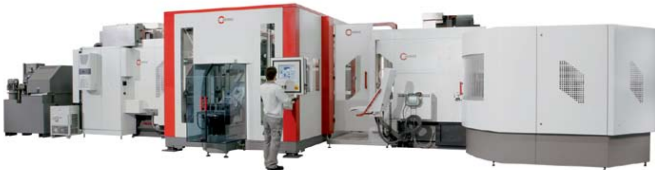
Рис. 3 Роботизированная система RS 2 адаптирована к двум обрабатывающим центрам С 40 U dynamic. Один робот обслуживает два станка. При этом возможна работа параллельно на обоих станках в ручном или автоматическом режиме.