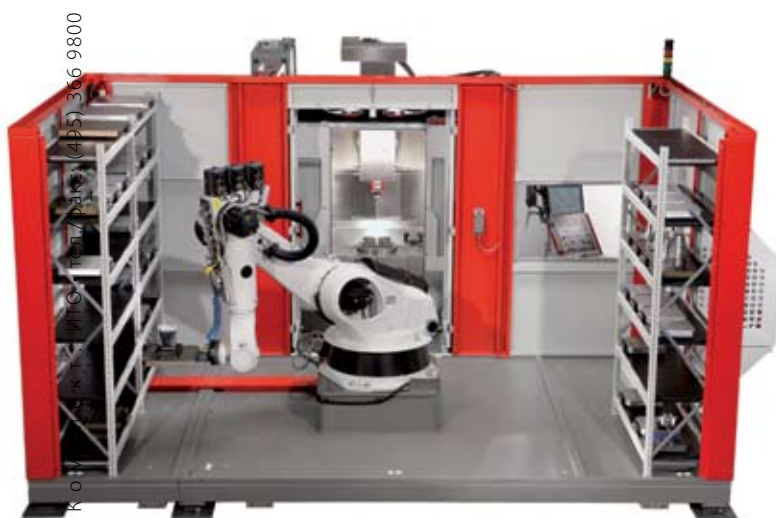
Рис. 6. Роботизированная система с двумя магазинами паллет при загрузке в 5-осевой высокопроизводительный обрабатывающий центр (передняя стенка защитного кожуха для наглядности снята).

Роботизированные системы повышенной грузоподъемности RS3 и RS4 используются в качестве манипуляторов для паллет различных размеров ( RS3 – 630×630×400 мм и RS4 – 1000×800×800 мм) с транспортной массой, соответственно, до 500 и 1000 кг. Используемые для них магазины могут иметь индивидуальную конфигурацию с возможностью интеграции двух обрабатывающих центров. В целом роботизированные системы RS2 , RS3 и RS4 разработаны в качестве «платформ», на базе которых возможна реализация индивидуальных технических решений в соответствии с требованиями заказчика. Дополнительным вариантом является роботизированная система RS 2L , которая представляет собой роботизированную ячейку с роботом, перемещающимся линейно по 7-й оси, причем из расположенного в линию магазина осуществляется снабжение нескольких установленных в ряд обрабатывающих центров. Роботизированное оборудование позволяет реализовать высокоэффективное производство деталей в течение семи дней, что наглядно доказали и продолжают доказывать уже смонтированные у заказчиков 120 роботизированных производственных систем Hermle. На сегодняшний день работают более 200 комплексных производственных систем с различной степенью автоматизации, причем именно с такой, какая подходит для заказчика.