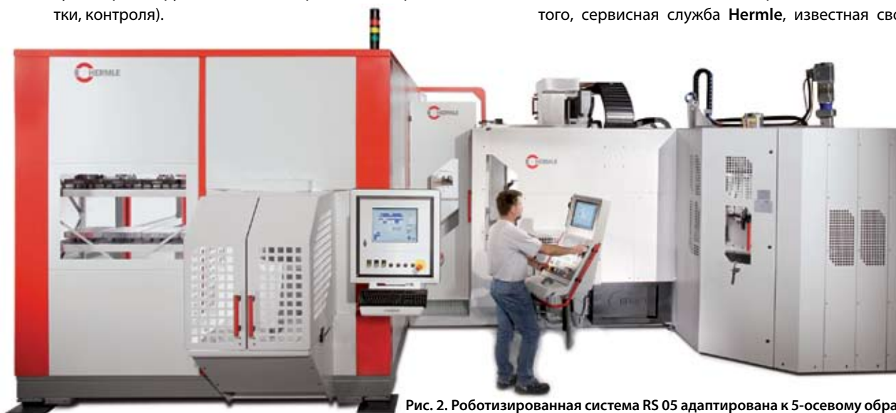
Рис. 2. Роботизированная система RS 05 адаптирована к 5-осевому обрабатывающему центру С 40 U dupatis. Роботизированная система имеет модульную конструкцию в качестве манипулятора для обрабатываемых деталей и/или паллет.

Так как технологические процессы на предприятии специального машиностроения отличаются от предприятия, выпускающего серийную продукцию, фирма HLS ведет свою деятельность как самостоятельная фирма, пользуясь при этом всеми необходимыми ресурсами основной фирмы. Важнейшее преимущество для заказчиков и пользователей заключается в том, что они получают готовые комплексные решения от одного ответственного исполнителя, причем все места стыковки конструкции, систем управления и программного обеспечения оптимизированы изготовителем. Кроме того, сервисная служба Hermle , известная своим высоким