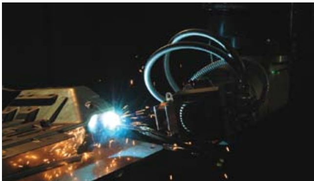
Рис. 6. Лазерная сварка на установке Prima RAPIDO для демонстрации того, что готовые детали автомобилей обладают аналогичной степенью сопротивления ударам, что и детали, изготовленные при контактной сварке, но количество сварных швов уменьшено на 35 %.

Сварка автомобильных кузовов обеспечивает легкость, качество, надежность и низкую стоимость автомобилей за счет снижения количества деталей и их массы, а также за счет снижения количества сварных швов. К тому же, штамповка кузовных деталей, изготовленных из трех дополнительных заготовок и двух сварных швов, заменяет девять операций штам-