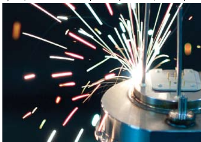
Рис. 4. Лазерная сварка высокоточного электромеханического медицинского оборудования с помощью установки лазерной резки LASERDYNE 430

В середине 60-х годов, вскоре после изобретения лазера, он стал использоваться для производства деталей кардиостимуляторов. С тех пор функции и биосовместимость данного устройства были существенно усовершенствованы, а модельный ряд лазеров для обработки медицинского оборудования значительно увеличился. На данный момент посредством лазерной технологии выполняется высокопрецизионная, эффективная и качественная обработка широкого спектра устройств – начиная со стентов, протезов, дефибрилляторов, кардиостимуляторов и заканчивая стерильной упаковкой (Рис. 4 и 5).