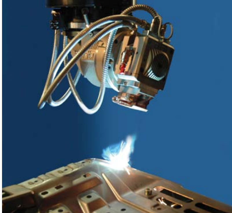
Рис. 1. Сиденье в сборе, изготовленное сваркой внахлестку посредством установки Prima RAPIDO. На заднем плане показан процесс сварки компонентов из низкоуглеродистой стали толщиной 2 и 1,5 мм, используемых при сборке каркаса автомобильного сиденья

Промышленная лазерная технология способна взять на себя роль инструмента развития российского производства воздушных судов, автомобилей и медицинского оборудования нового поколения, а также множества других электрических и механических компонентов, требующих высокой точности обработки. В данной статье представлены возможности лазерной сварки, способной заменить другие производственные процессы в целях снижения расходов и повышения качества как уже существующих, так и новых конструкций соответствующих компонентов.