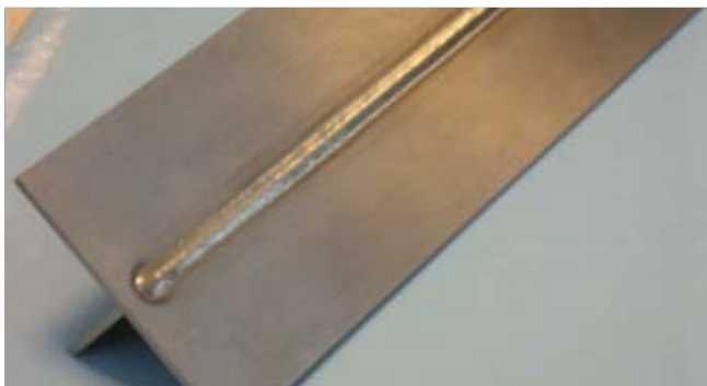
Рис. 2. Цвет сварного шва ярко-серебряный. Данный цвет указывает на небольшое количество окисления (<20 частиц на миллион), говорящего о прочности конструкции

При альтернативной обработке с использованием лазерной сварки применяются две пластины размером 130×100×10 мм (масса: 0,57 кг) и 50×6×130 мм (масса: 0,17 кг) с общей массой 0,74 кг. Соответствующий коэффициент использования материала при лазерной сварке равен 3,5 к 1, что означает снижение количества материалов для изготовления детали практически на 80 %.