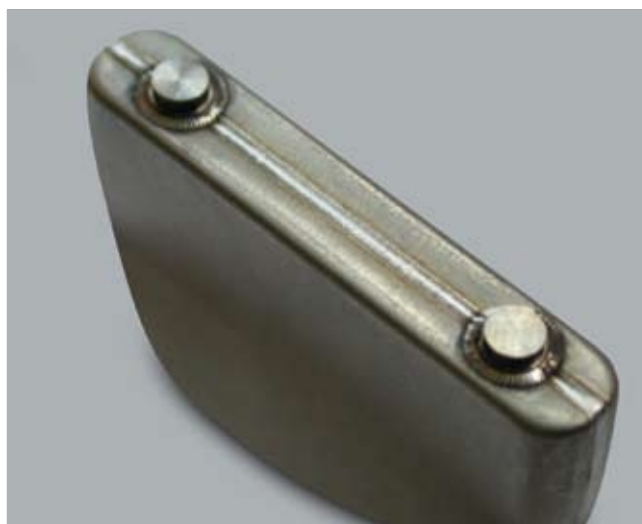
Рис. 5. На протяжении многих лет установки лазерной резки LASERDYNE применяются при сварке точных и герметичных швов на компонентах из различных металлов и сплавов, например, на представленном выше кардиостимуляторе. Высокая степень повторяемости процессов – главное преимущество систем лазерной сварки

Во время лазерной сварки при необходимости лазерный луч может быть сфокусирован до диаметра, равного одной сотой микрометра (0,004 дюйма), что способствует минимальному нагреванию поверхностей, граничащих со свар-