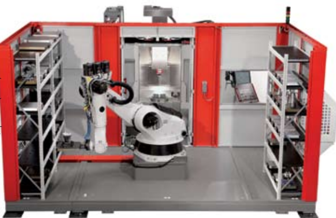
Рис. 6. Роботизированная система с двумя магазинами паллет при загрузке в 5-осевой высокопроизводительный обрабатывающий центр (передняя стенка защитного кожуха для наглядности снята).

05 • 2015 • К о м п л е к т : ИТО • тел./факс: (495) 366-9800