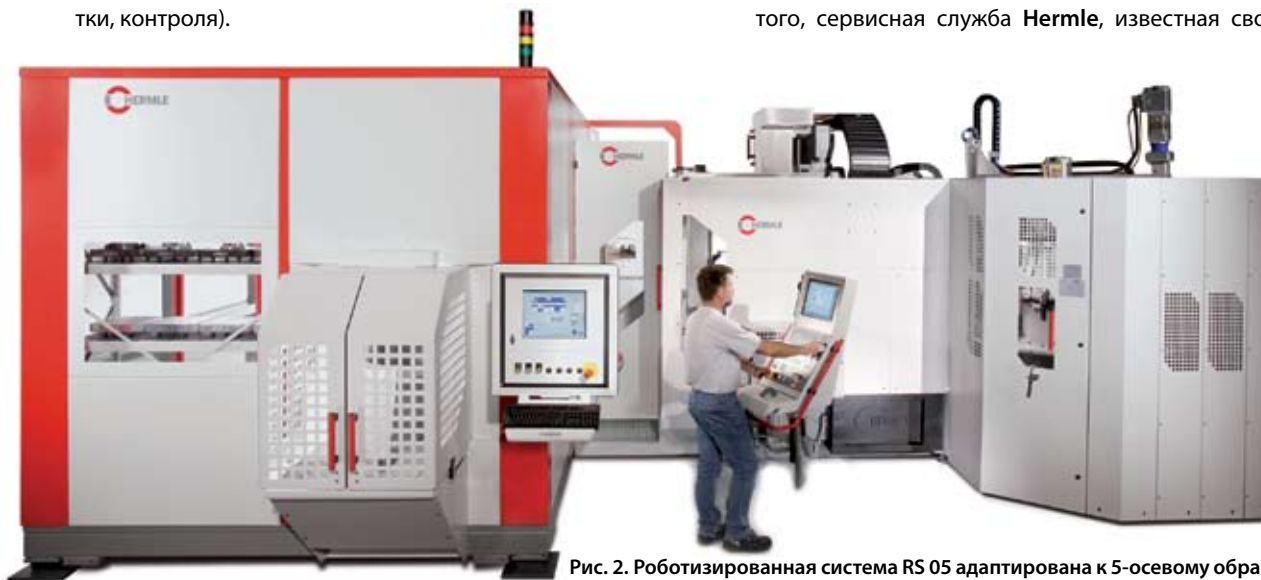
Рис. 2. Роботизированная система RS 05 адаптирована к 5-осевому обрабатывающему центру С 40 U дупаmic. Роботизированная система имеет модульную конструкцию в качестве манипулятора для обрабатываемых деталей и/или паллет.

Так как технологические процессы на предприятии специального машиностроения отличаются от предприятия, выпускающего серийную продукцию, фирма HLS ведет свою деятельность как самостоятельная фирма, пользуясь при этом всеми необходимыми ресурсами основной фирмы. Важнейшее преимущество для заказчиков и пользователей заключается в том, что они получают готовые комплексные решения от одного ответственного исполнителя, причем все места стыковки конструкции, систем управления и программного обеспечения оптимизированы изготовителем. Кроме того, сервисная служба Hermle, известная своим высоким