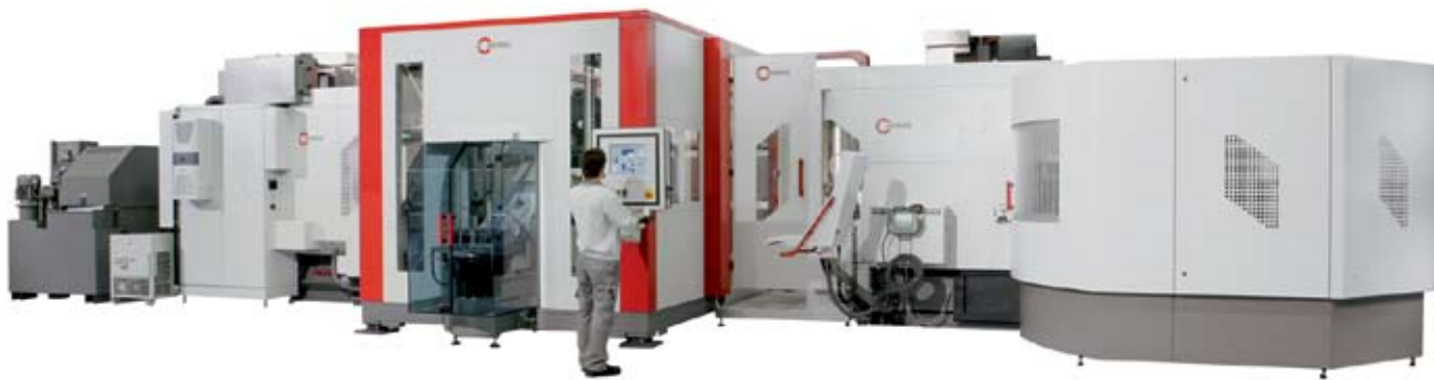
Рис. 3 Роботизированная система RS 2 адаптирована к двум обрабатывающим центрам С 40 U dynamic. Один робот обслуживает два станка. При этом возможна работа параллельно на обоих станках в ручном или автоматическом режиме.

качеством, выполняет все соответствующие работы по техническому обслуживанию, благодаря чему заказчик и в этой сфере имеет одного-единственного компетентного партнера. Для Герда Шорпа, директора-соучредителя фирмы HLS Hermle Leibinger Systemtechnik GmbH, очевидно, что по причине усложнившихся задач системной интеграции, профиль предъявляемых требований в значительной степени изменился, вследствие чего он рассматривает сферу деятельности фирмы HLS как в производстве специальных станков, так и в интеграции систем: «В зависимости от организационной структуры пользователя и применяемой технологии предпочтение отдается соответствующим образом согласованной автоматизации. У предприятия серийного производства требования иные в сравнении с штучным или мелкосерийным производством. Поэтому мы в тесном сотрудничестве с нашим головным предприятием и другими изготовителями предлагаем точно подобранные компоненты, которые затем проектируем, изготавливаем и монтируем у заказчика. При изготовлении деталей, узлов и подсистем мы используем мощности головного предприятия, с которым мы имеем общую цель относительно поставок и соблюдения сроков. Так как мы, в противоположность другим производителям специальных станков и системной интеграции, владеем специализированным «ноу-хау» в технологии обработки резанием, а также компетенцией в разработке технологических решений, заказчик, обращаясь к нам, получает в нашем лице надежного партнера».