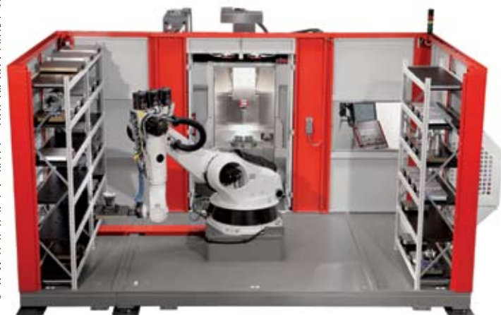
Рис. 6. Роботизированная система с двумя магазинами паллет при загрузке в 5-осевой высокопроизводительный обрабатывающий центр (передняя стенка защитного кожуха для наглядности снята).

Роботизированные системы повышенной грузоподъемности RS3 и RS4 используются в качестве манипуляторов для паллет различных размеров ( RS3 – 630×630×400 мм и RS4 – 1000×800×800 мм) с транспортной массой, соответственно, до 500 и 1000 кг. Используемые для них магазины могут иметь индивидуальную конфигурацию с возможностью интеграции двух обрабатывающих центров. В целом роботизированные системы RS2 , RS3 и RS4 разработаны в качестве «платформ», на базе которых возможна реализация индивидуальных технических решений в соответствии с требованиями заказчика. Дополнительным вариантом является роботизированная система RS 2L , которая представляет собой роботизированную ячейку с роботом, перемещающимся линейно по 7-й оси, причем из расположенного в линию магазина осуществляется снабжение нескольких установленных в ряд обрабатывающих центров. Роботизированное оборудование позволяет реализовать высокоэффективное производство деталей в течение семи дней, что наглядно доказали и продолжают доказывать уже смонтированные у заказчиков 120 роботизированных производственных систем Hermle. На сегодняшний день работают более 200 комплексных производственных систем с различной степенью автоматизации, причем именно с такой, какая подходит для заказчика.