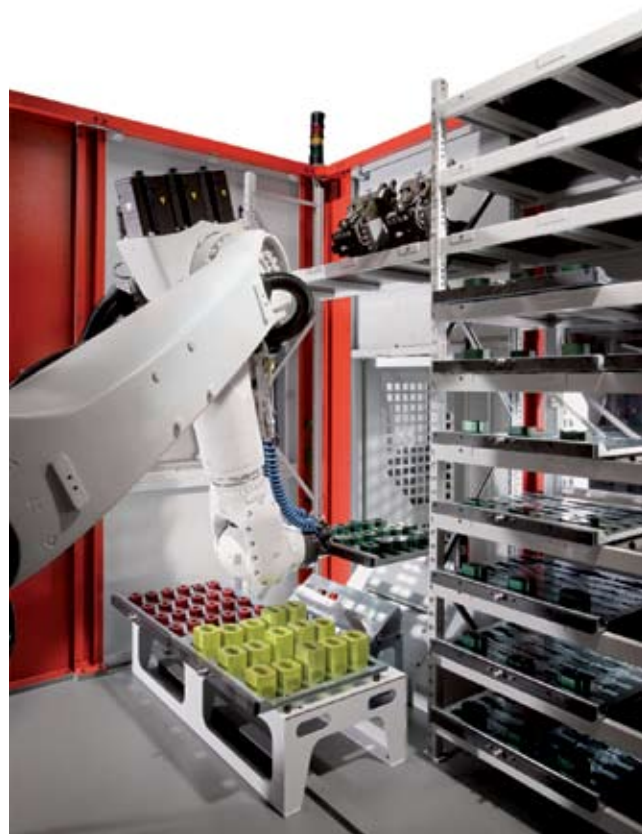
Рис. 4. Роботизированная система RS 2 адаптирована к двум обрабатывающим центрам С 40 U dynamic. Один робот обслуживает два станка. При этом возможна работа параллельно на обоих станках в ручном или автоматическом режиме.

Другим оборудованием, обеспечивающим автоматизированное производство деталей, являются системы IN типоразмеров IN 30 , IN 60 и IN 100 . Они представляют собой закрытые и адаптируемые к обрабатывающим центрам стандартизованные модули, включающие систему манипуляторов, в которые можно загружать, в зависимости от размера, до 90 паллет или обрабатываемых деталей. Они хранятся там, автоматически подаются телескопической рукой на обработку и после обработки возвращаются обратно в магазин. В зависимости от времени обработки деталей это обеспечивает автономный режим работы в одну или несколько смен. Системы IN в зависимости от типоразмера рассчитаны на транспортный вес до 30 кг ( IN30 ), 60 кг ( IN60 ) или 100 кг ( IN100 ).