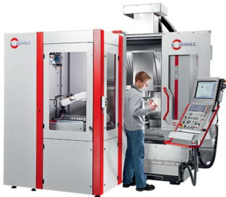
Рис. 1. Роботизированная система RS 05, адаптированная к 5-осевому обрабатывающему центру С 20 U. Автоматизированная установка площадью 2 м 2 прекрасно подходит для предприятий медицинской техники и точного приборостроения