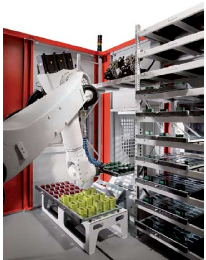
Рис. 4. Роботизированная система RS 2 адаптирована к двум обрабатывающим центрам C 40 U dynamic. Один робот обслуживает два станка. При этом возможна работа параллельно на обоих станках в ручном или автоматическом режиме.

Другим оборудованием, обеспечивающим автоматизированное производство деталей, являются системы ИН типоразмеров ИН 30 , ИН 60 и ИН 100 . Они представляют собой закрытые и адаптируемые к обрабатывающим центрам стандартизованные модули, включающие систему манипуляторов, в которые можно загружать, в зависимости от размера, до 90 паллет или обрабатываемых деталей. Они хранятся там, автоматически подаются телескопической рукой на обработку и после обработки возвращаются обратно в магазин. В зависимости от времени обработки деталей это обеспечивает автономный режим работы в одну или несколько смен. Системы ИН в зависимости от типоразмера рассчитаны на транспортный вес до 30 кг ( ИН30 ), 60 кг ( ИН60 ) или 100 кг ( ИН100 ).