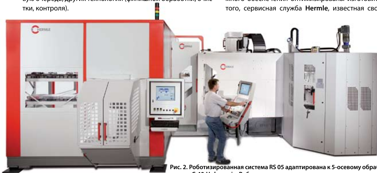
Рис. 2. Роботизированная система RS 05 адаптирована к 5-осевому обрабатывающему центру С 40 U dupatis. Роботизированная система имеет модульную конструкцию в качестве манипулятора для обрабатываемых деталей и/или паллет.

Так как технологические процессы на предприятии специального машиностроения отличаются от предприятия, выпускающего серийную продукцию, фирма HLS ведет свою деятельность как самостоятельная фирма, пользуясь при этом всеми необходимыми ресурсами основной фирмы. Важнейшее преимущество для заказчиков и пользователей заключается в том, что они получают готовые комплексные решения от одного ответственного исполнителя, причем все места стыковки конструкции, систем управления и программного обеспечения оптимизированы изготовителем. Кроме того, сервисная служба Hermle , известная своим высоким