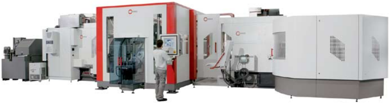
Рис. 3 Роботизированная система RS 2 адаптирована к двум обрабатывающим центрам C 40 U dynamic. Один робот обслуживает два станка. При этом возможна работа параллельно на обоих станках в ручном или автоматическом режиме.