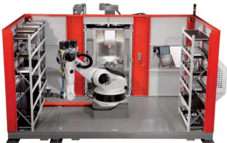
Рис. 6. Роботизированная система с двумя магазинами паллет при загрузке в 5-осевой высокопроизводительный обрабатывающий центр (передняя стенка защитного кожуха для наглядности снята).

Роботизированные системы повышенной грузоподъемности RS3 и RS4 используются в качестве манипуляторов для паллет различных размеров ( RS3 – 630×630×400 мм и RS4 – 1000×800×800 мм) с транспортной массой, соответственно, до 500 и 1000 кг. Используемые для них магазины могут иметь индивидуальную конфигурацию с возможностью интеграции двух обрабатывающих центров. В целом роботизированные системы RS2 , RS3 и RS4 разработаны в качестве «платформ», на базе которых возможна реализация индивидуальных технических решений в соответствии с требованиями заказчика. Дополнительным вариантом является роботизированная система RS 2L , которая представляет собой роботизированную ячейку с роботом, перемещающимся линейно по 7-й оси, причем из расположенного в линию магазина осуществляется снабжение нескольких установленных в ряд обрабатывающих центров. Роботизированное оборудование позволяет реализовать высокоэффективное производство деталей в течение семи дней, что наглядно доказали и продолжают доказывать уже смонтированные у заказчиков 120 роботизированных производственных систем Hermle. На сегодняшний день работают более 200 комплексных производственных систем с различной степенью автоматизации, причем именно с такой, какая подходит для заказчика.