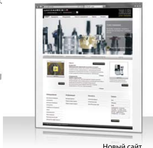
Новый сайт на русском языке: www.zoller-ru.com

Устройства предварительной настройки, измерения и проверки отличаются высочайшим уровнем точности, эргономикой, низкими требованиями к обслуживанию и удобной в использовании технологией. Благодаря этому сокращается время простоя станка, уменьшается процент брака, повышается качество продукции и эффективность технологических процессов.