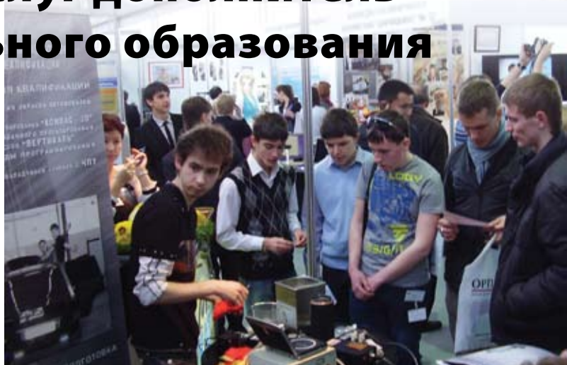
На стенде Политехнического колледжа

Выпускники колледжа имеют высокий уровень подготовки, однако речь пойдет не о выпускниках колледжа, бывших школьниках, но о взрослых, которые повышают квалификацию или получают новые специальности. Количество