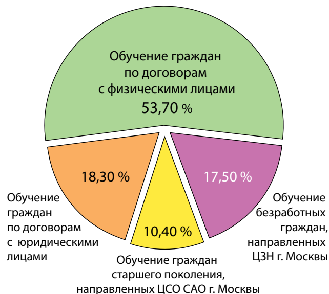
Рис. 2. Распределение в процентном соотношении обучающихся по программам ДПО

Исходя из востребованных на рынке образовательных услуг профессиональных образовательных программ колледжа можно выделить 3 категории обучающихся граждан: граждане, направленные предприятиями города Москвы и Московской области, службами занятости города Москвы, индивидуально обучающиеся. И, как видно из диаграммы, доля обучения граждан по договорам с физическими лицами со-