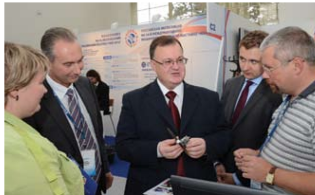
На стенде Политехнического колледжа на выставке MSV в Чехии

Реализация выше указанных программ дополнительного профессионального образования обеспечена современной высокотехнологичной материальной базой, позволяющей значительно повысить качество подготовки обучающихся