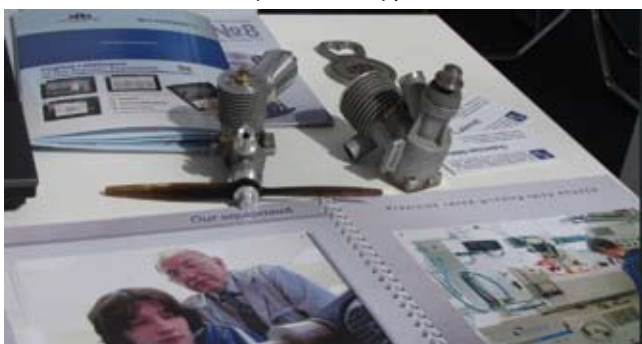
Двигатели внутреннего сгорания для кордовой модели

12 сентября на выставке MSV – 2012 прошел “День Москвы”. Департамент науки, промышленной политики и предпринимательства города Москвы принимал активное участие в MSV – 2012. Среди участников выставки был представлен и социальный партнёр по образовательным программам Политехнического колледжа №8 им. И.Ф. Павлова ЗАО «Связь инжиниринг», на котором проходит производственная практика и стажировка студентов колледж, трудоустройство выпускников и повышение квалификации сотрудников колледжа.