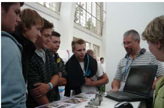
Студенты чешских школ на стенде Политехнического колледжа №8 им. И. Ф. Павлова

12 сентября на выставке MSV – 2012 прошел “День Москвы”. Департамент науки, промышленной политики и предпринимательства города Москвы принимал активное участие в MSV – 2012. Среди участников выставки был представлен и социальный партнёр по образовательным программам Политехнического колледжа №8 им. И.Ф. Павлова ЗАО «Связь инжиниринг», на котором проходит производственная практика и стажировка студентов колледж, трудоустройство выпускников и повышение квалификации сотрудников колледжа.