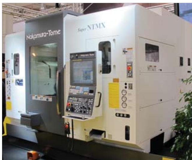
Станок Super NTMX фирмы Nakamura Tome на выставке EMO'11

При управлении станком Super NTMX оператор хорошо видит ход обработки. Режимы фрезерования близких к тем, которые применяются на вертикальных обрабатывающих центрах, а режимы обточки при использовании основного шпинделя, противושпинделя и нижней револьверной голо-