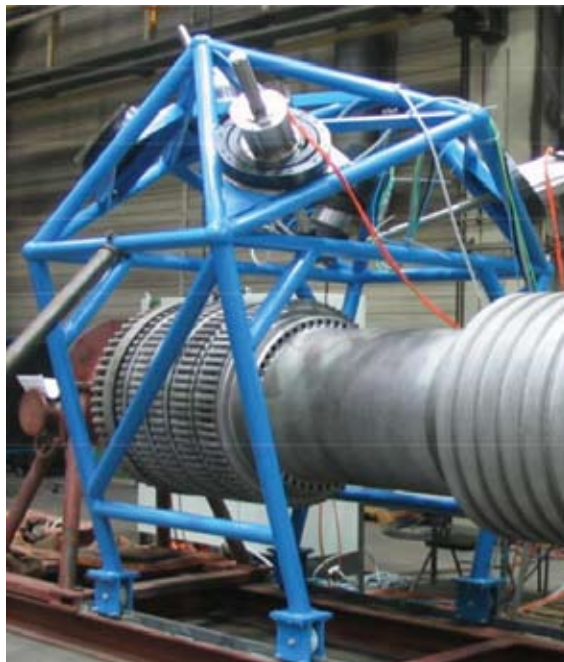
Обработка крупных сварных конструкций

Система координат станка по всем 6 степеням свободы смещается, то есть поворачивается так, что соответствует определённой координатной системе детали, т.е. все программируемые перемещения станка относятся к координатным осям обрабатываемой детали, даже если они располагаются перевёрнутыми или смещёнными в пространстве.