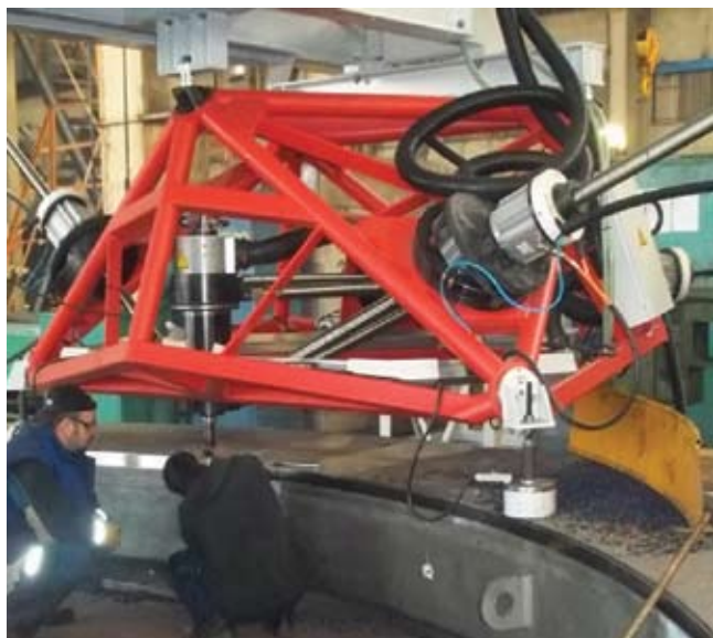
Ремонтное фрезерование на турбинах