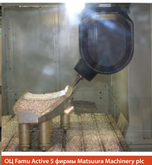
ОЦ Famu Active 5 фирмы Matsuura Machinery plc

06 / 2012 • Издательство: «ИТО» • e-mail: ito@ito-news.ru