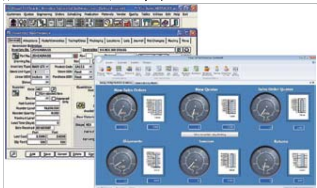
Управленческий пульт Visual EstiTrack Executive Dashboard

Система CNC Series Oi-Model D реализует наноинтерполяцию, что позволяет получать особо гладкие поверхности при высоких скоростях резания и подачи. Новым модулем серии Oi является Dual Check Safety, который использует несколько процессоров системы CNC для перекрестного контроля данных и осуществления мониторинга критических точек зрения работоспособности и безопасности компонентов станка, что обеспечивает выполнение требований международных стандартов безопасности без необходимости использования дополнительных защитных устройств [33].