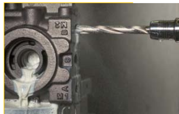
Рис. 5. Обработка корпуса из чугуна

Сменные режущие пластины (рис. 4) HT 800 WP для обработки сталей выполняются с углом при вершине 140° с двухплоскостной заточкой и допуском на диаметр по h7.