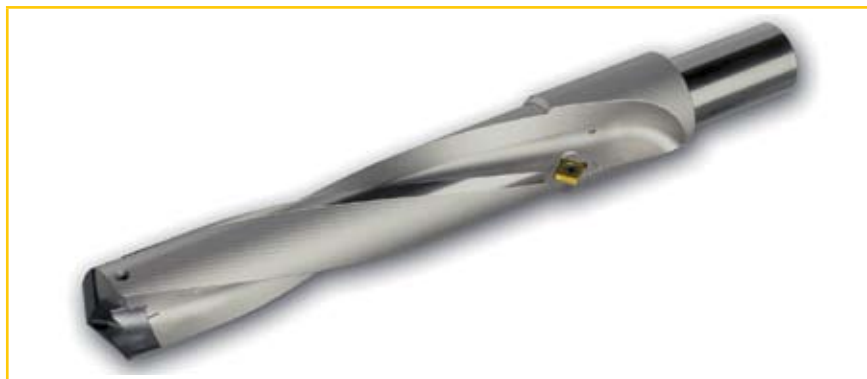
Рис. 8. Комбинированное сверло d=40 мм, с пластиной для снятия фасок