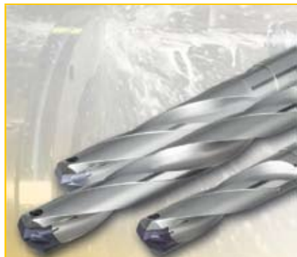
Рис. 1. Сверлильная система HT 800 WP

Новая сверлильная система HT 800 WP (рис. 1) фирмы GÜHRING (Германия) основана на взаимозаменяемости режущих пластин и корпусов. Она является идеальной для производства высокоточных отверстий больших диаметров. Данные сверла находят широкое применение для обработки деталей электро- и ветряных станций, газовых и паровых турбин и т.п.