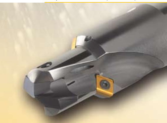
Рис. 7. Пилотное сверло с фаскообразователем

Для обработки нержавеющей стали, жаропрочных и титановых сплавов сменные пластины имеют покрытие «nanoA», коническую заточку, угол при вершине 140° и допуск на диаметр по h7. Для зацентровки отверстий применяют универсальные сменные пластины с покрытием «nanoA», с конической заточкой, с углом при вершине 150° и допуском на диаметр по m7 (рис. 7).