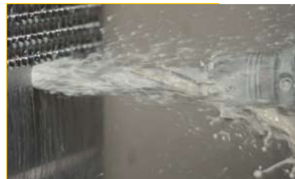
Рис. 4. Обработка закаленной стали

ответствует общепринятому стандарту закрепления многих видов инструментального крепежа в производстве, в любое время и без каких-либо проблем возможен переход на систему сверлильного инструмента HT 800 WP.