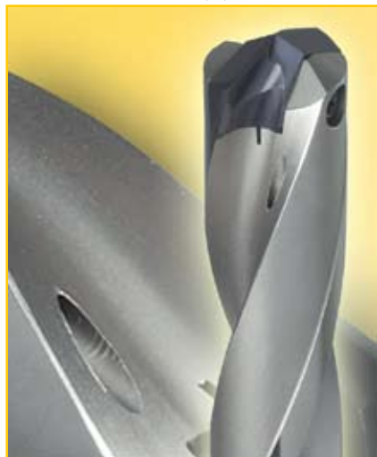
Рис. 2. Сверла HT 800 WP (3D; 5D; 10D)

С 5 видами сменных пластин HT 800 WP и 6 видами взаимозаменяемых корпусов компания GÜHRING предлагает высокопроизводительную и экономически целесообразную обработку отверстий, в том числе и центровочных, в диапазоне диаметров от 11,00 до 40,00 мм в различных материалах, таких как конструкционные, нержавеющие и жаропрочные стали, чугуны и алюминий.